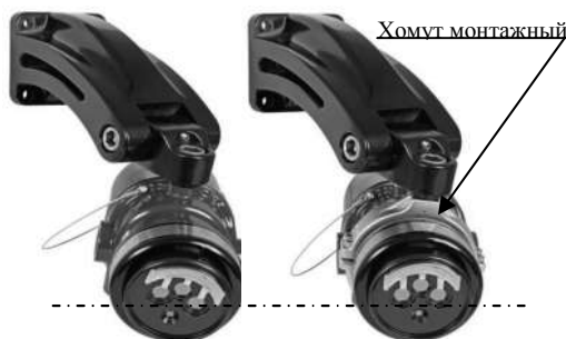
Рисунок – Применение монтажного хомута

в) К кронштейну Q9033В1000-R также может быть заказан хомут монтажный Q9033 СПАРК. Хомут монтажный является дополнительным устройством, повышающим степень свободы при креплении извещателя, и предназначен для тех случаев, когда оси симметрии установленного кронштейна и закрепленного на нем извещателя не совпадают и расходятся под довольно большим углом. В этих случаях хомут позволяет выровнять извещатель по горизонту.